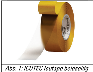
Abb. 1: ICUTEC Icutape beidseitig